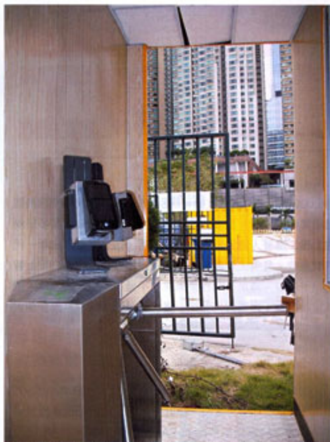
● 配備AccuFACE裝置的工地出入口，每天紀錄員工上下班及午膳的時間。